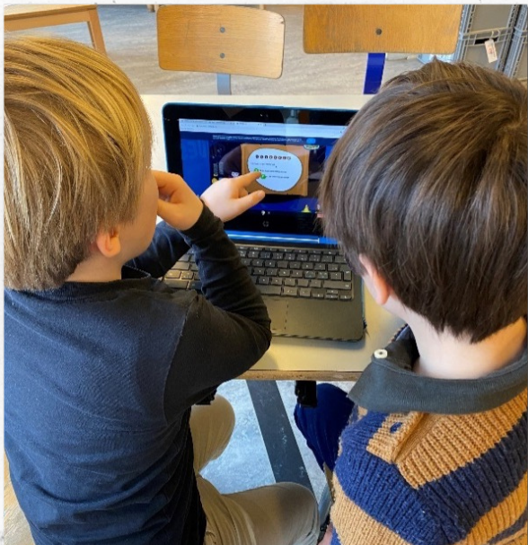
Der er blevet læst og stavet