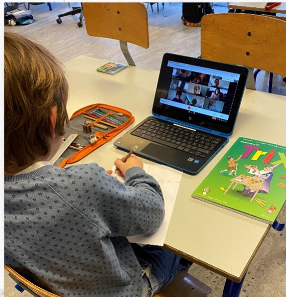
Der er blevet regnet og lavet opgaver i TRIX