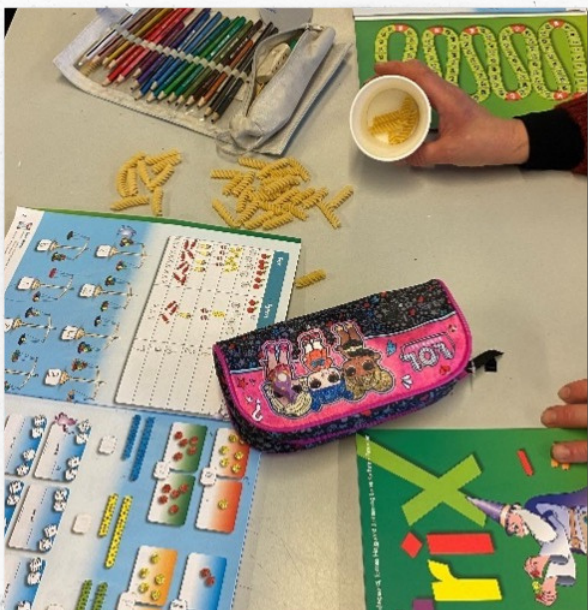
Der er blevet lært minus med pastaskruer