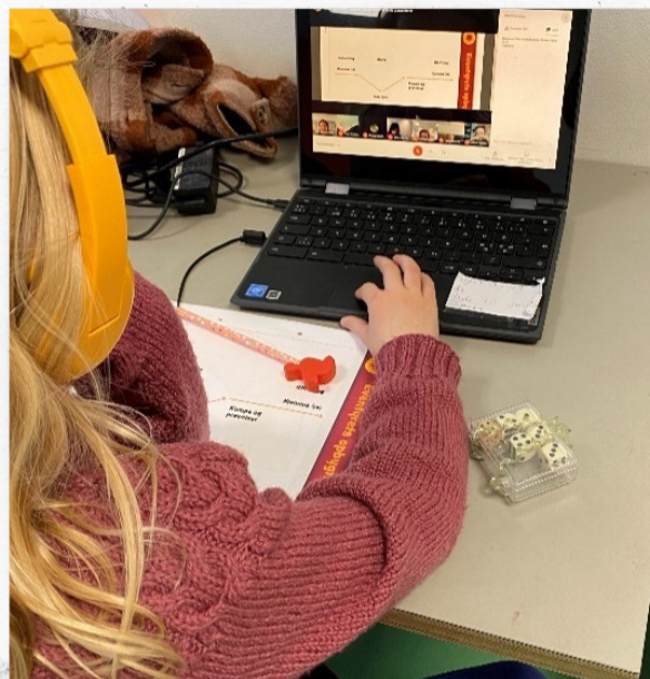
2. klasse har lært om eventyrets opbygning i dansktimerne